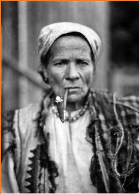
fot. M. Rosenbaum, 1934, Państwowe Archiwum Cyfrowe