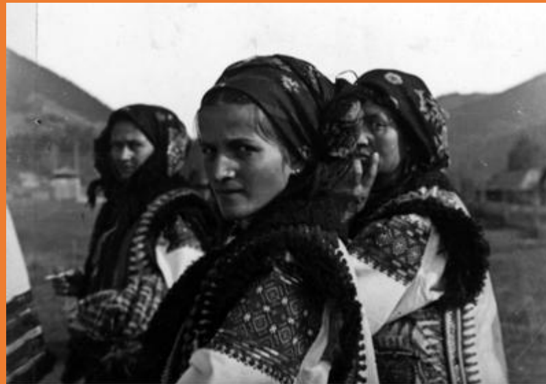
fot. Leo Stanisław (1925-33), Narodowe Archiwum Państwowe